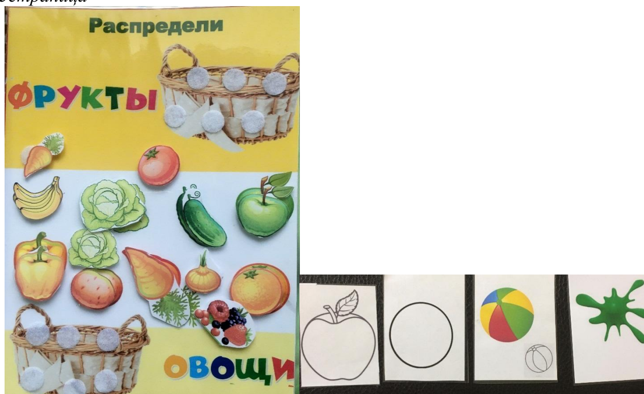
Дидактическая игра «Распредели фрукты и овощи»

Цель игры: закрепить знания детей о фруктах и овощах.